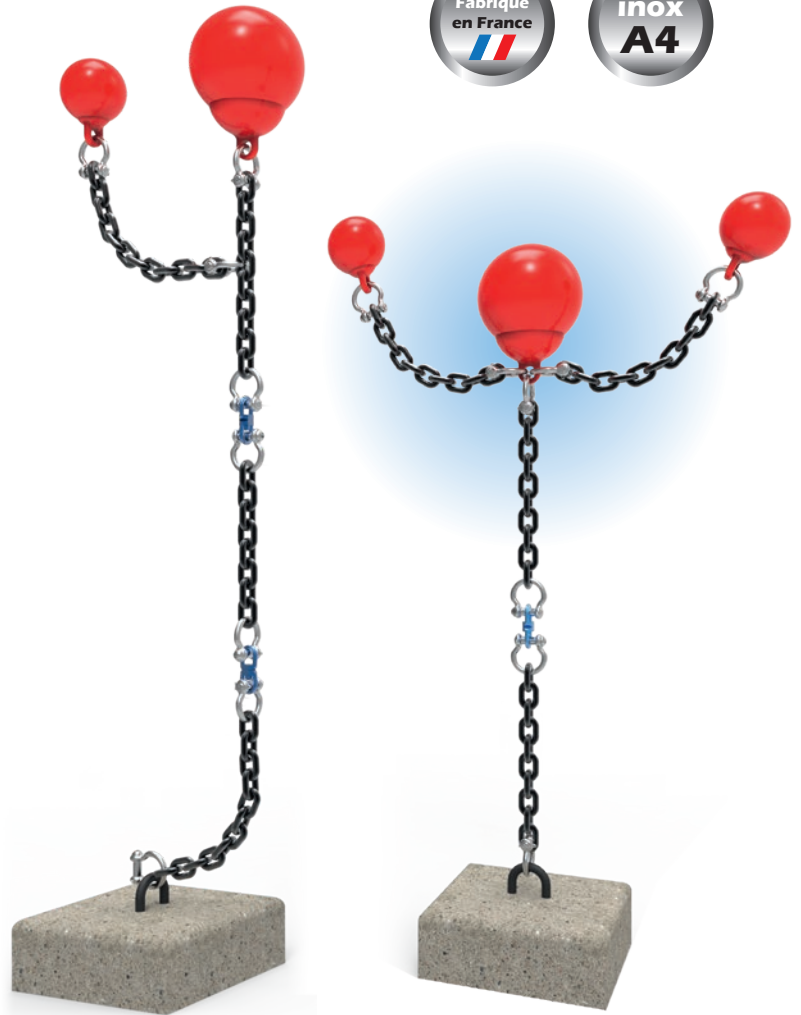
EXEMPLES DE CONFIGURATION DE CHAINE DE MOUILLAGE