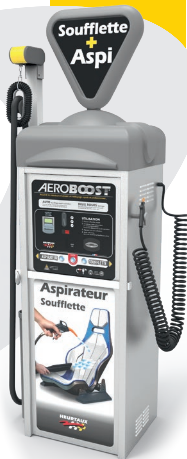
machine présentée avec options